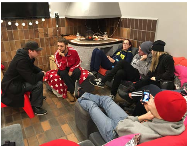
Unga på Morris fritidsgård i Farsta

I början av oktober besökte Fritidsförbundet Morris fritidsgård och har med stöd av de unga berättat om